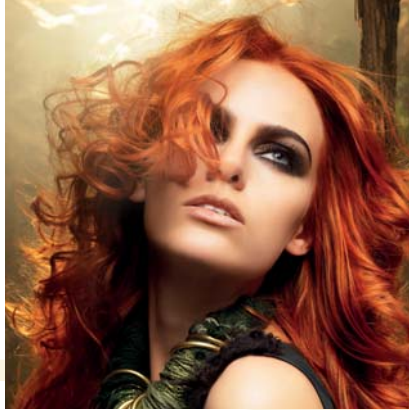
Italian Style Framesi