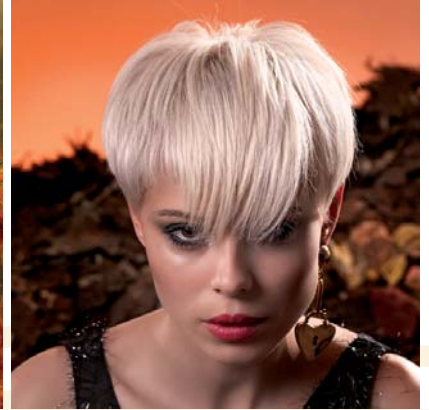
Italian Style Energy